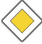
شارع رئيسي / ذو أفضلية

يجب إعطاء المركبات الأخرى الأفضلية لكم عند وجود هذه اللوحات